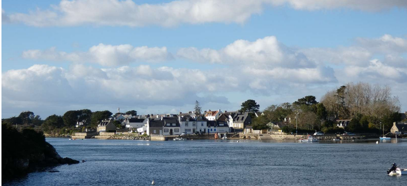
Vue sur le village du Vieux Passage