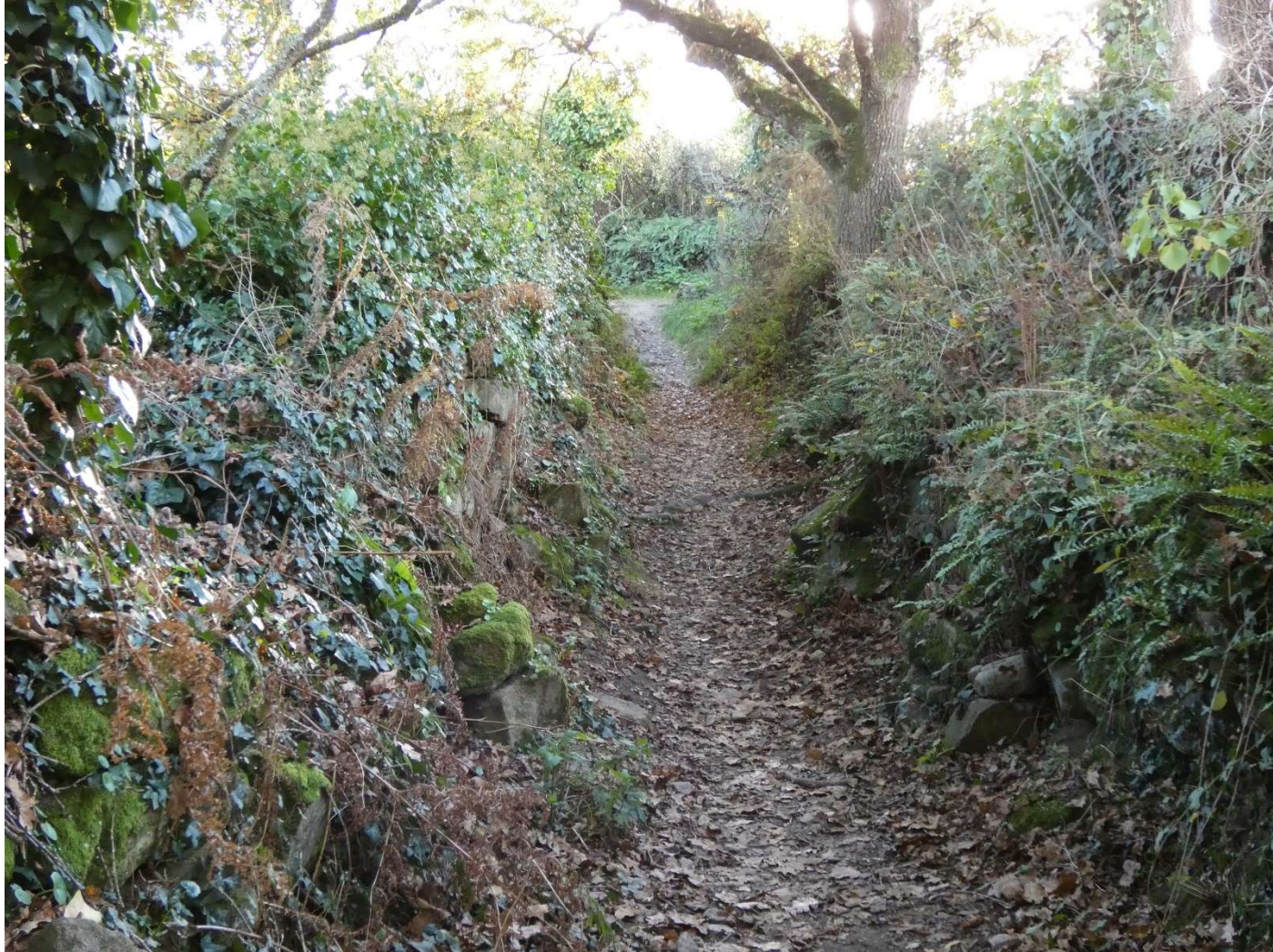
Le passage en sous-bois

Inscriptions pour cette sortie à l'adresse mail ci-dessous :