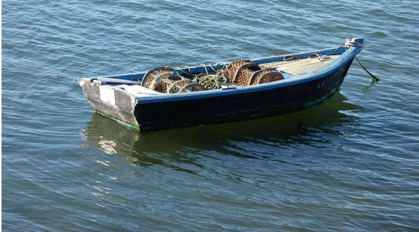
Barque et ses casiers à crustacés