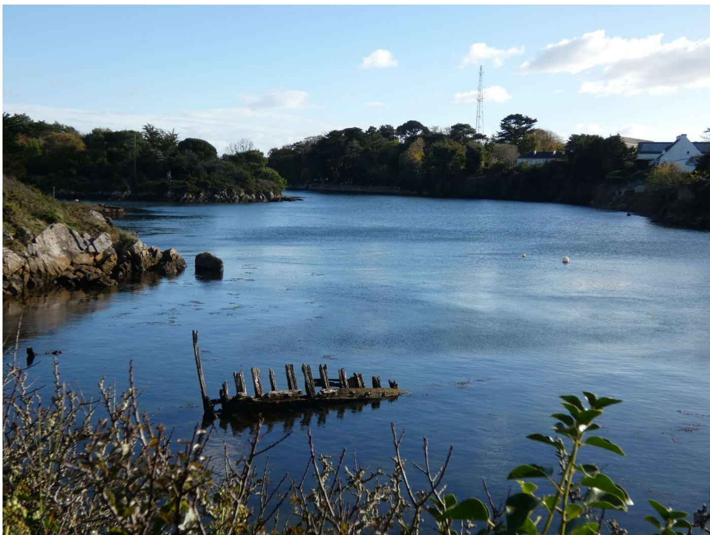
Un reste de thonier