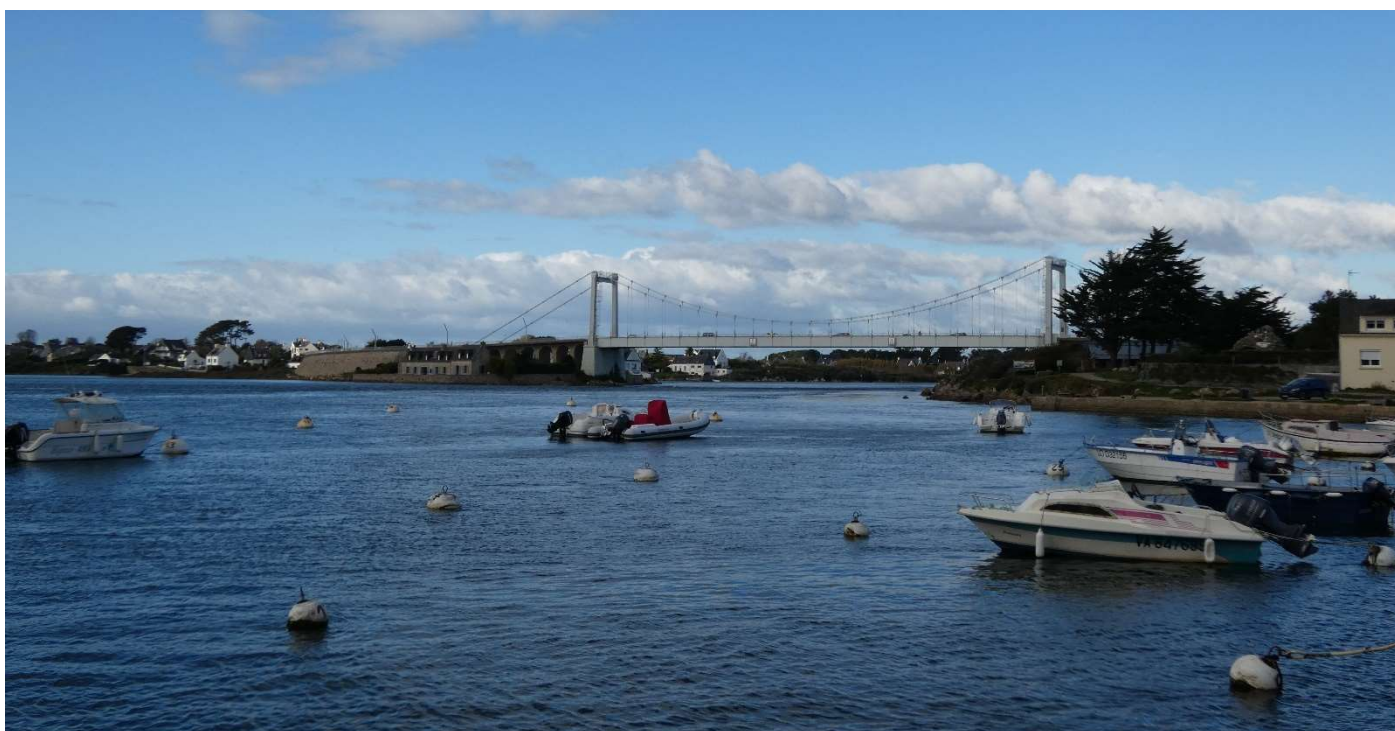
Port Niscop et vue sur le pont Lorois

Prévoyez de bonnes chaussures, nombreux rochers et racines affleurant le chemin.