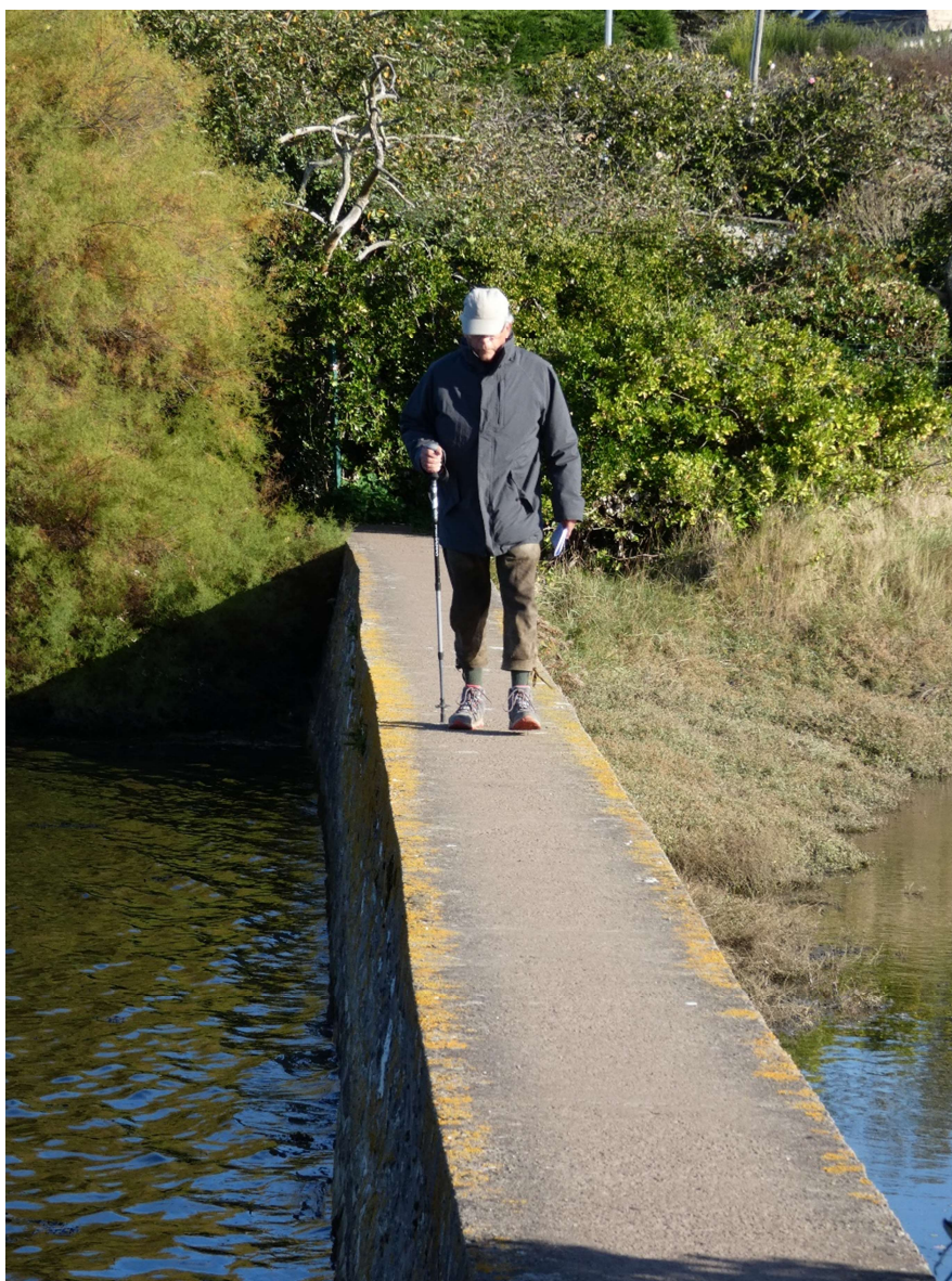
Passage sur digue