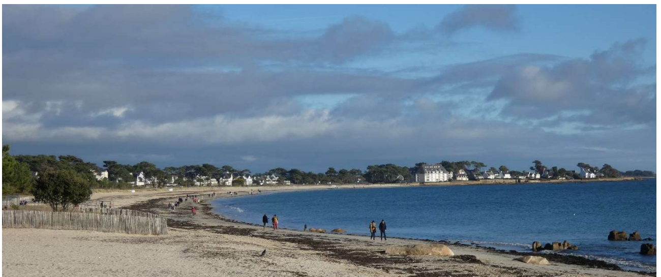
Quelques belles demeures

Informations tirées de Wikimédia : https://fr.wikipedia.org/wiki/Carnac#La Belle %C3%89poque